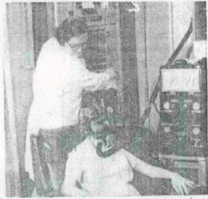
16 אלן בניאדס שימשו - לאורך תקופה של 40 שנה - כ"שפנים" לצורך ניסויים בקרינה רדיואקטיבית בארה"ב, מסרה אתמול מחלקת האנרגיה האטומית בתמונה, שפורסמה אתמול לראשונה, נראית הזיקת של חומר רדיואקטיבי לאשה במעבדה בקליפורניה ב-1968.

מכסות של ילדים חטופים הוטברו גם לארה"ב לניסויים רפואיים ורדיואקטיביים. זה היה שכר השתיקה לממשלת ארה"ב, על שהעלימה עין ממכירת הילדים שנשלחו לארה"ב לאימוץ, ולא הפעילה עליהם את חוקי ההגירה הנוקשים שלה.